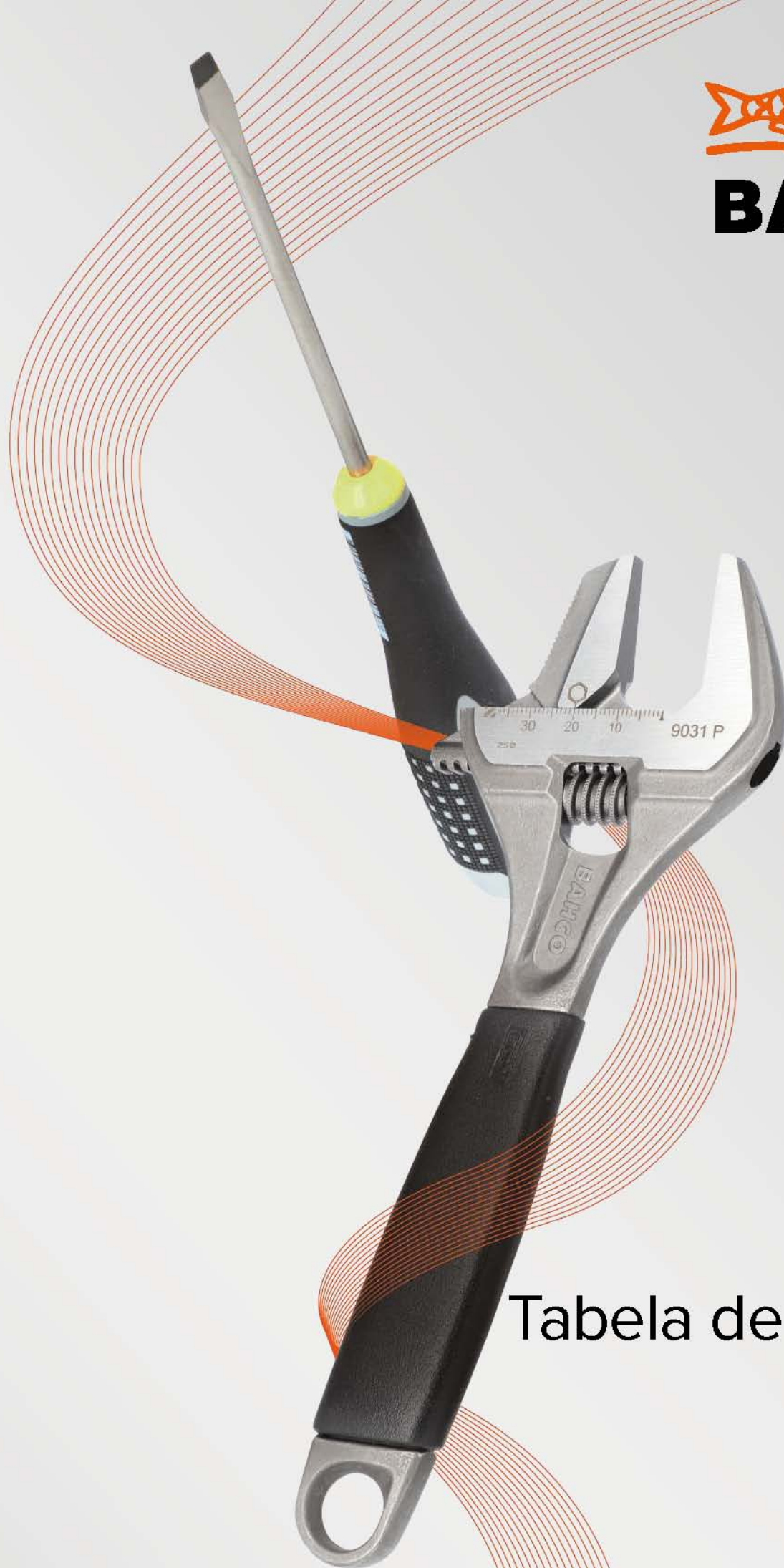
Tabela de Preços 2024