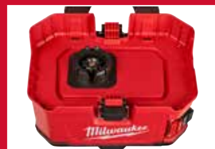
Desenho de depósitos intercambiáveis