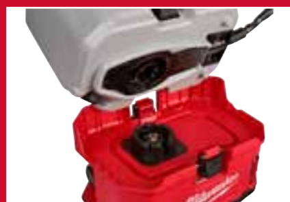
Juntas do depósito substituíveis para eliminar os riscos de contaminação entre produtos químicos