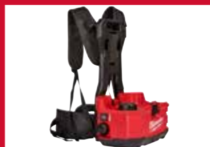
Alças cómodas para uma utilização intensiva durante longos períodos